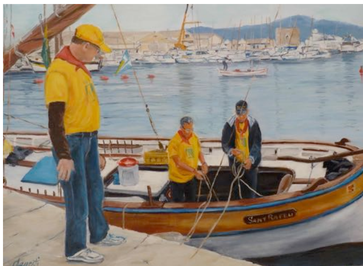
Visuel 5 - Le Sant-Raffeu à Saint-Tropez, 50 x 70 cm