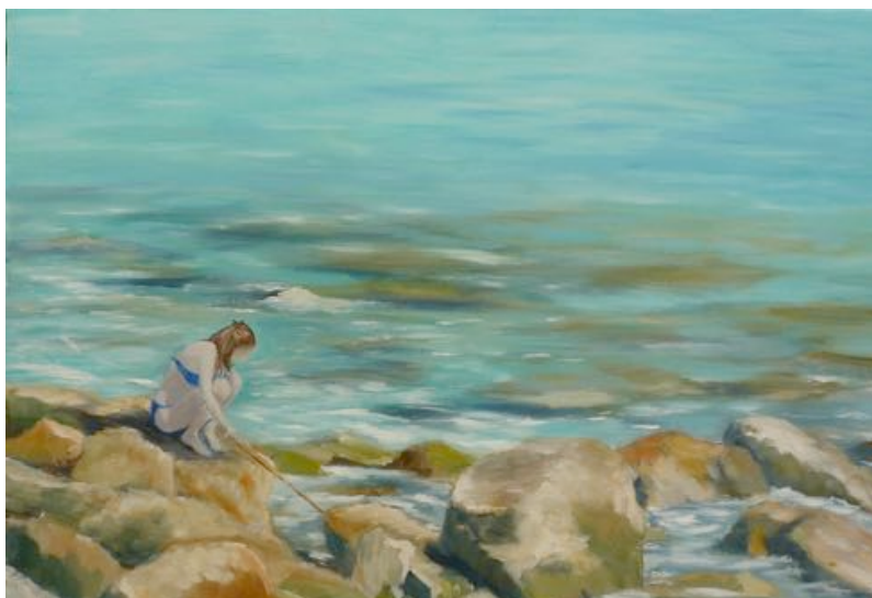
Visuel 4 - Sur les rochers de Cassis, 50 x 70 cm