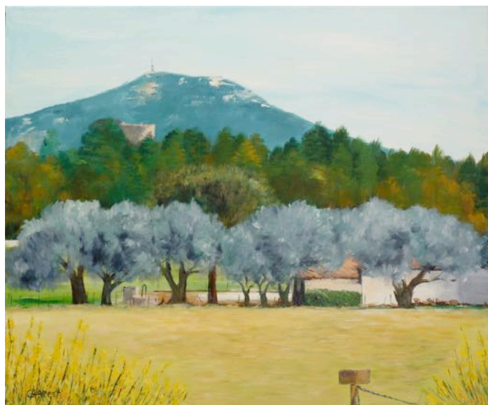
Visuel 3 - Les oliviers, 73 x 60 cm