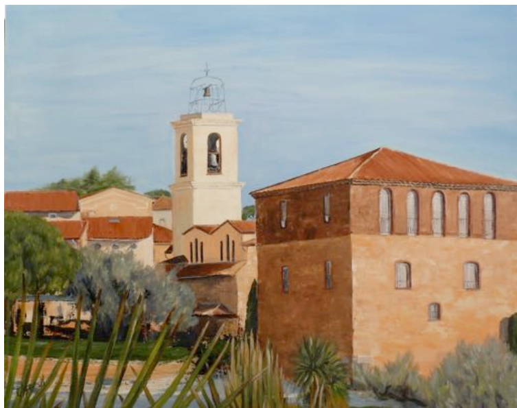
Visuel 1 - La Tour Carrée de Sainte-Maxime, 80 x 100 cm